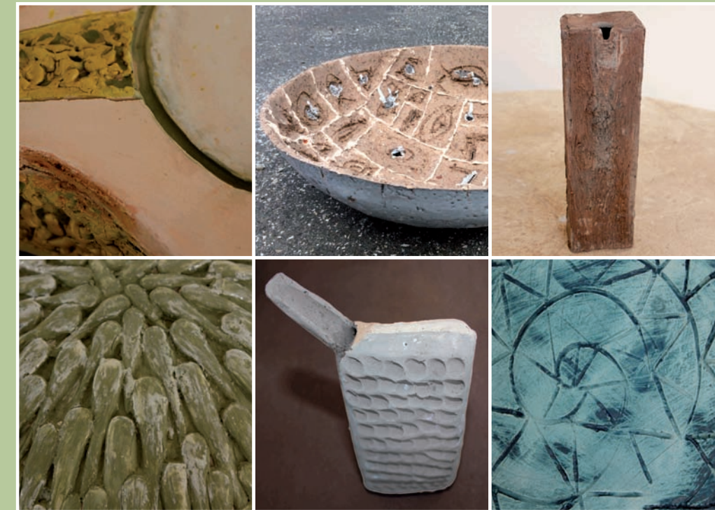
Antonia Toseva National Academy of Arts Sofia, Bulgaria