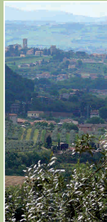
Veduta di Torgiano - Umbria View of Torgiano - Umbria